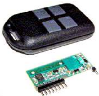
Рис.1 Общий вид приемника и передатчика

Устройство дистанционного управления представляет собой комплект из четырехкнопочного передатчика, сделанного в виде брелока, и приемника, в виде платы размером 40x15 мм, имеющего логические выходы. Каждый выход приемника управляется соответствующей кнопкой на пульте передатчика, при этом на выходах приемника формируются уровни логической единицы. Передача команд осуществляется по радиоканалу на частоте 433 МГц широтно-импульсной модуляцией. Каждый пульт и приемник имеет свой персональный (прошитый) код, поэтому какие-либо совпадения между комплектами исключены.