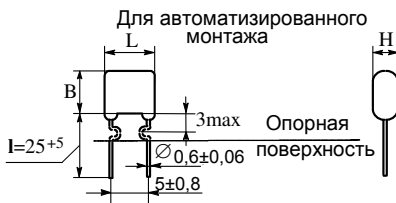
К10-17в, ОСК10-17в, К10-17-4в (рис. 3)

Конденсаторы К10-17 предназначены для работы в цепях постоянного, переменного токов и в импульсных режимах. Конденсаторы изготавливают в соответствии с: