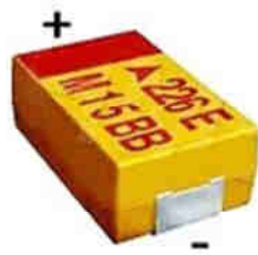
22 мкФ 25В