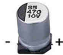
470 мкФ 10 В

У танталовых SMD конденсаторов на корпусе маркируется положительный вывод сплошной полосой или черточкой. Тут легко перепутать с выводными электролитическими, у которых черточкой или полосой обозначается минусовой контакт. У электролитических SMD обозначается минусовой контакт, так же как и у выводных.