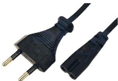
Артикул Q-3069 (прямой)