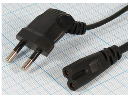
Артикул Q-3069У (угловой)