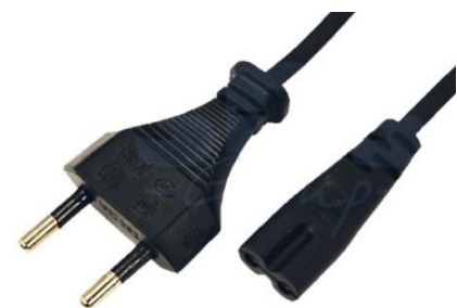
Артикул Q-3069 (прямой)