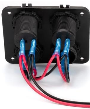
Схема подключения DSF

Клеммы на задней панели обозначены знаками «+» и «-» для положительного и отрицательного полюсов